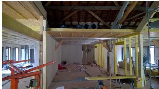
Pole écoconstruction de Loches pendant les travaux