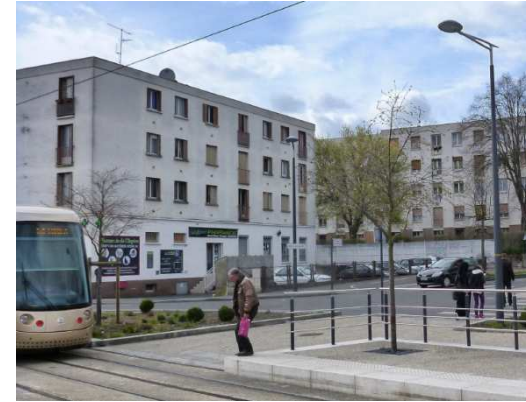
Copro la prairie - avant