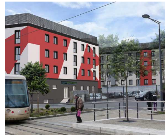
Copro la prairie - après