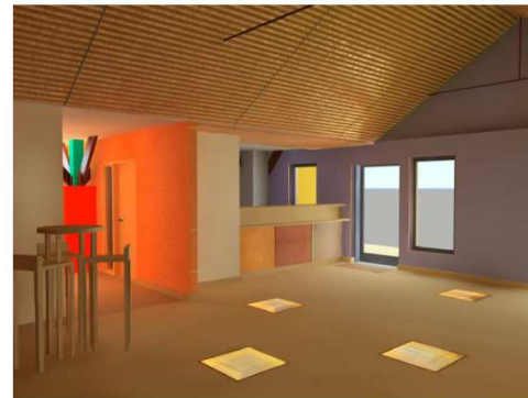
Pole écoconstruction de Loches vue d'architecte